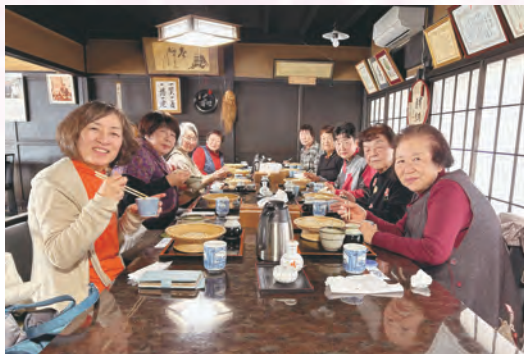
強化月間お疲れ様会 (榛東支部)