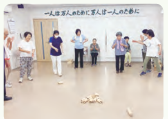
モルックを初体験