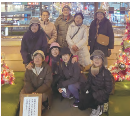
高崎駅のイルミネーション見学(八木原支部)