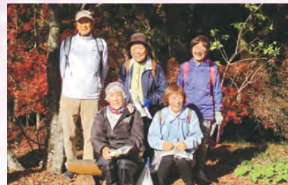
赤城自然園でウォーキング (子持支部)