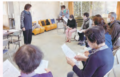
上三原田サロン (赤城支部)