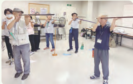
スポーツウエルネス吹き矢を体験

健康づくりや仲間づくりに役立つ北毛保健生協らしいスポーツウエルネス吹矢班会を昨年6月から毎月1～2回定期的に開催しています。11月には「北毛誰でも健康吹矢愛好会」と命名し正式に会として活動しています。「礼に始まり礼に終わる」基本動作、スポーツウエルネス吹矢呼吸法の指導を徹底的に受け、的に当たった時の喜び、爽快感などを仲間と楽しんでいます。