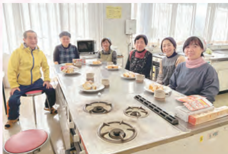
シフォンケーキ作り (北橘支部)