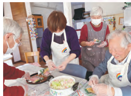
レンチン料理教室 (市街地西部支部)