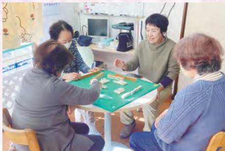
café あじさい麻雀 (豊秋支部)