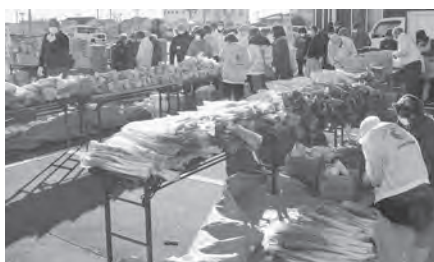
組合員さんから提供された野菜

にも影響がありました。多くの団体、個人から多くのカンパを頂くことが出来ました。 県内の企業にも協力を要請し、山崎製パン(株)、正田醤油(株)、コープぐんまからお菓子、調味料、食料品を提供していただきました。 今回も多くの協力で開催する事が出来、大変感謝しております。 今後も定期的な開催を計画し、自治体をはじめ多くの団体、企業、個人と連携を図り、地域の「困った」をみんなの力で乗り越えていく輪をつくるとともに社会問題として取り組んでいきたいと思ひます。