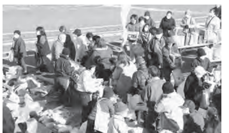
品物を受け取る来場者