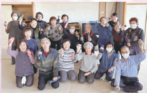
ダンベル体操 (吉岡支部)