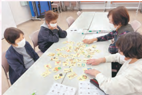
すこしおカルタ (有馬支部)