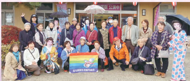
支部旅行 まんてん星の湯 (金島支部)